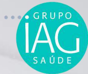
Tabela-Resumo das Marcas do Grupo IAG Saúde